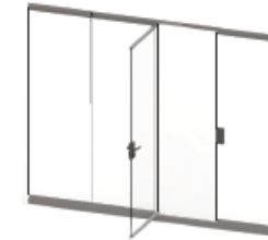
SLIDING DOOR ABIERTO