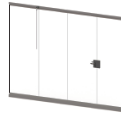
SLIDING DOOR CERRADO